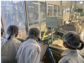
<日の出屋製菓産業株式会社>

もちろん、社会科の学習なので、それぞれの仕事をしておられる方の工夫や努力を学ぶことが一番の目的ですが、そこで働いておられる方から見えてくる「職業の有り様」も子供たちにとっては大きな学びになるなど感じました。見学させていただいた皆様、ありがとうございました。