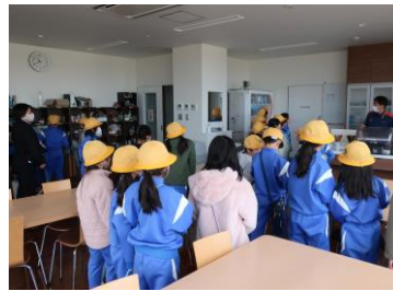
<南砺消防署東分署>